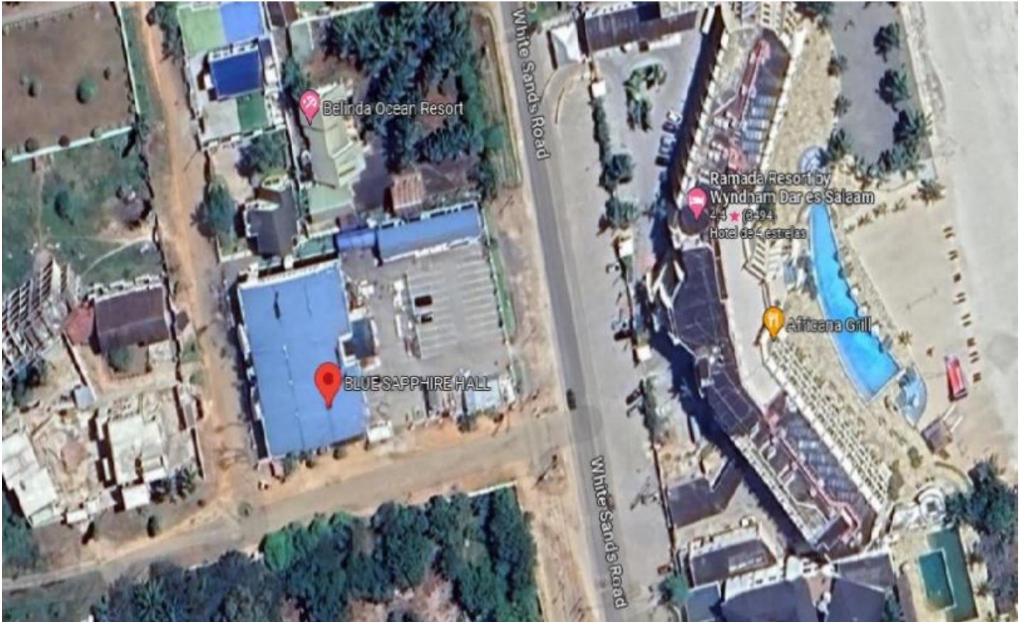
Localización del “Blue Sapphire Hall”