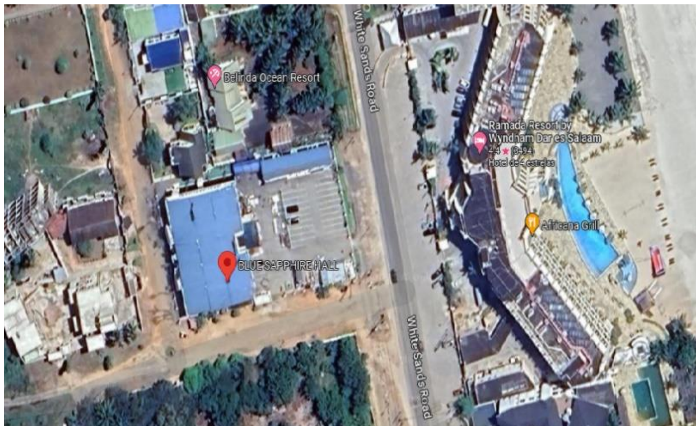
Localização do “Blue Sapphire Hall”